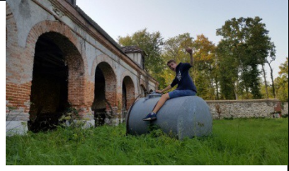
Château de Chambray