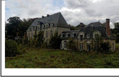
Château des singes